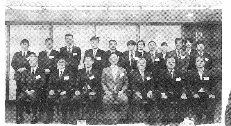
precoteコーティングパートナー会参加者